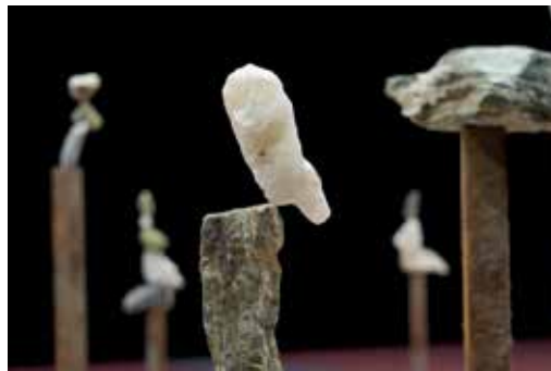
Equilibria © Nick Steur

Faire corps Les photographies de Denis Darzacq mettent en forme une énergie libératrice qui circule de ses modèles à nous, pour faire corps. Jusqu'au dimanche 16 mars. La Confluence, Betton.