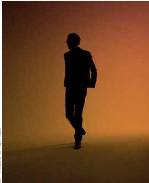
Alain Chamfort