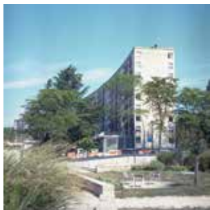
Photographie issue de la série "Ancien bâti futur musée" © Candice Hazard

Jusqu'au dimanche 20 avril. Musée des beaux-arts, Rennes,