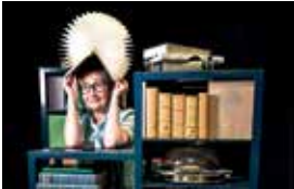
La Bibliothé-Claire © Sagliocco Ensemble