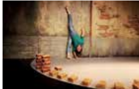
Des nuits pour voir le Jour