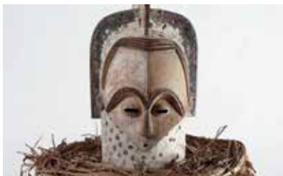
© Musée des beaux-arts de Rennes

Actualité oblige, nous faisons un tour à l'annexe des Beaux-Arts à Maurepas. On s'y retrouve ?