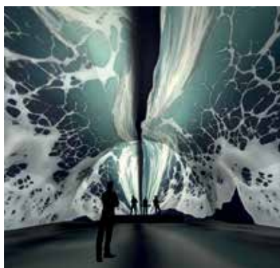
DansO Fleuves