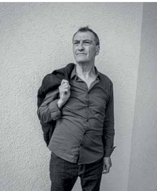
Pépite Mateo