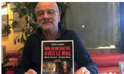
Francis Nachbar © DR