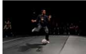
Rites de passage

La Bibliothé-Claire Un jour, Claire découvre un bébé-livre aux pages blanches. Elle décide alors de le nourrir d'alphabet et de contes. Mercredi 5 mars à 10h et 15h. Jeudi 6 à 10h et 14h30. Lillilco, Rennes. À partir de 3 ans