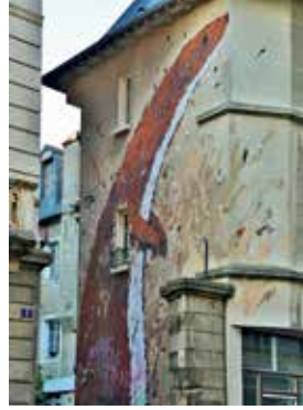
Street Art - WAR!

Le Golf de la Freslonnière : un jardin à l'anglaise ! Ou encore Histoires de Vins (47 rue Vasselot) : un jardin nature à la française !