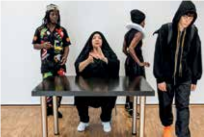
Histoires Décoloniales © A. Morot