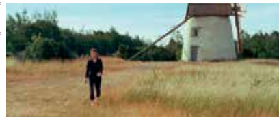
Bergman Island - Mia Hansen-Løve