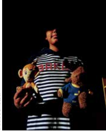
Smallamr © Emma Burlet