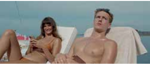
Sans titre - Ruben Östlund