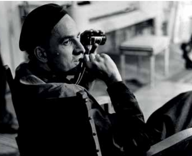
Ingmar Bergman