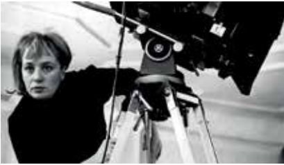
Mai Zetterling