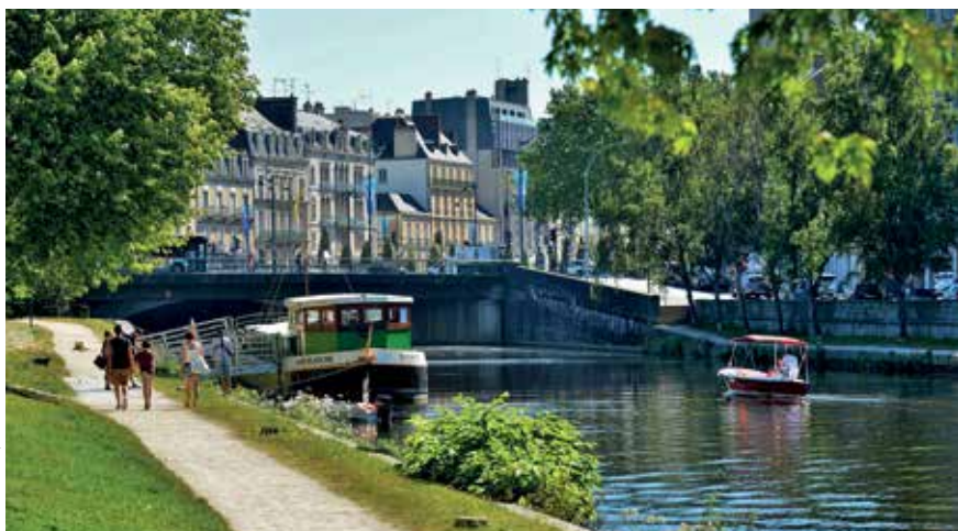
Bords de Vilaine, Rennes.