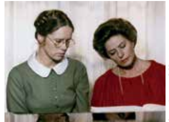
Sonate d'automne