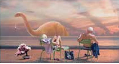
Cherry Collapse