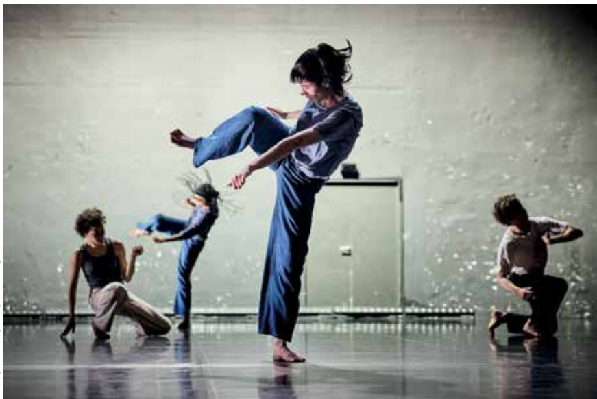
Cesce Up