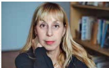
Lola Lafon