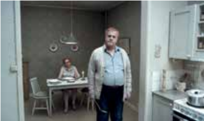
Pouff' éternité - Roy Andersson