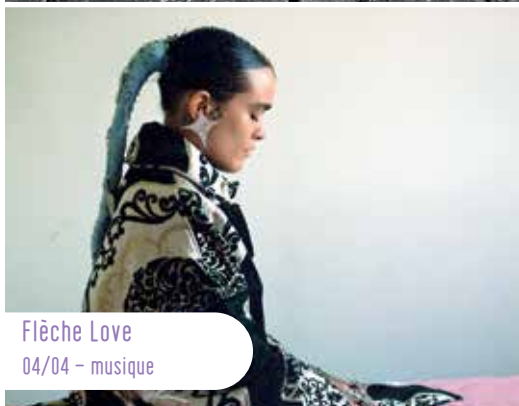
Flèche Love 04/04 - musique