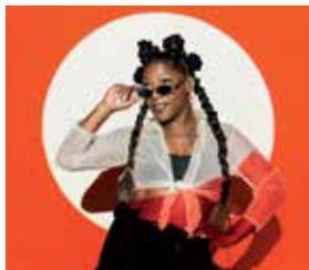
La Dame blanche