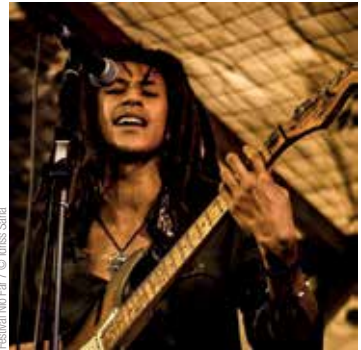
Festival Nio Far 7