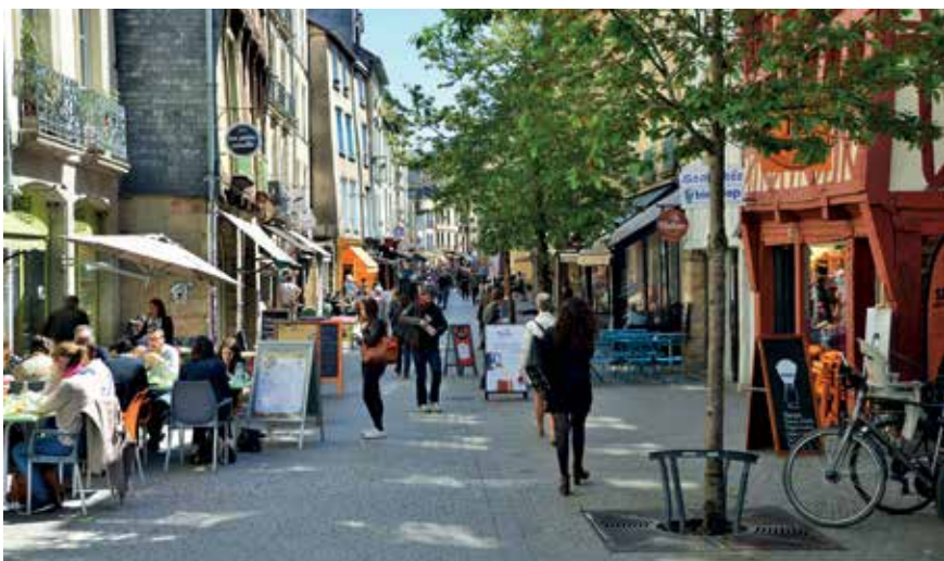
Rue Vasséat

Fondateur du collectif Soirée Vilaines Teuf, alliant musiques électro et performances drag, formika – que l'on appelle aussi Pim – est un artiste de musique électronique. Il pratique un son organique qui entend vous emmener dans un voyage envoûtant et progressif. À l'occasion de sa participation au Festival Maintenant , Wik lui a demandé sa vision de Rennes.