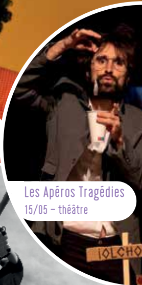
Les Apéros Tragédies 15/05 - théâtre