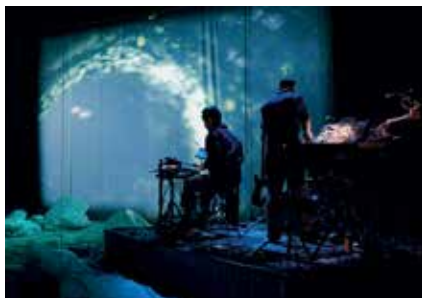
Sous les mers © Grandiel Loif Fern

Les plus grands pourront réfléchir ( Ah les rats, Comment je suis devenue ourse, Sous les mers ), rire ( Radio Banane ), frémir ( En haut En Bas , 16 au 18/10, Le Triangle) et vibrer ( Cœur avec les doigts , 17 au 18, L'Aire Libre) en assistant à l'une des