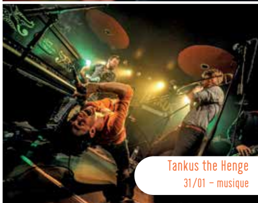
Tankus the Henge 31/01 - musique