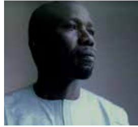
Ballaké Sissoko

Centre culturel Juliette Drouet, Fougères, 14 décembre.