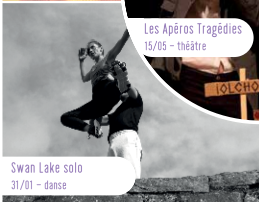
Swan Lake solo 31/01 - danse