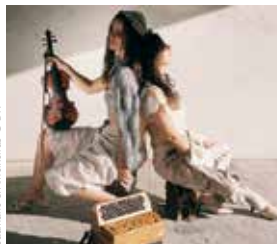
Caamaño & Ameixeiras

Le Grand Soufflet fête les musiques du monde et joue l'ouverture. À Rennes et dans tout le département, il accueille cette année des artistes du bassin méditerranéen, d'Amérique latine, d'Afrique, d'Europe du Nord et de l'Est... et de Bretagne aussi !