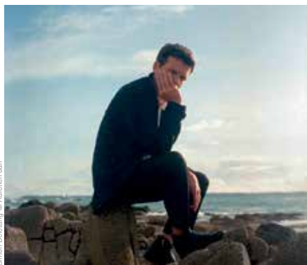
Simon Delétang