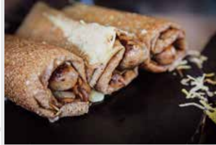
Marché des lices

Le marché des Lices. Je suis gourmand, les produits y sont