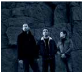
Fleuves © Eric Legret