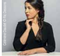
Célimène Daudet

Couvent des Jacobins, Rennes, 27 février 2025. • La Passerelle, Saint-Brieuc, 28 février 2025. • Centre Culturel Jacques Duhamel, Vitry, 1 er mars 2025.