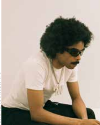
Rave Park - La Fève