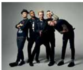
Sum 41