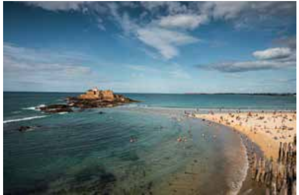
Panorama sur la plage de Bon Secours avec le Grand Bé en fond