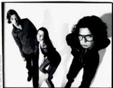
Bar Italia