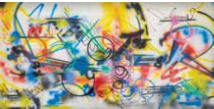
Aérosol : graffiti de Futura2000 réalisé sur la scène du Bataclan pendant le New York City Rap Tour, 1982, collection particulière

Teenage Kicks, projet développé en 2013 avec Mathias Brez. Ça prend de l'ampleur en restant à dimension humaine.