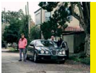
Kinds of Kindness