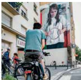
Teenage Kicks Tour