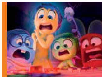
Vice-versa 2

Il se dit que c'est la 39 e adaptation (au moins !) à l'écran du roman d'Alexandre Dumas. Déjà bien rodés, en tant que scénaristes, avec leur version des Trois mousquetaires , Matthieu Delaporte et Alexandre de La Patellière récidivent dans le film de cape et d'épée. Porté par la prestation de Pierre Niney, leur Comte de Monte-Cristo s'annonce aussi efficace qu'une série américaine (Alexandre Dumas, l'inventeur du cliffhanger ?). Trop pour être honnête ?