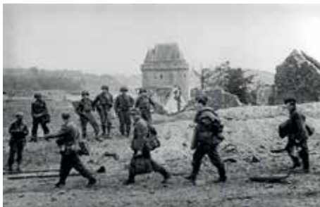
Des prisonniers allemands quittent la Cité d'Alot sous le regard des soldats américains, Saint-Malo, 17 août 1944 © Archives Lee Miller, Royaume-Uni, 2024.

L'Aparté, Domaine de Trémelin, Iffendic, jusqu'au 26 septembre.