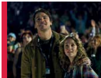
Trap

La sensualité des corps faisant écho à celle des montagnes a toujours été au cœur du cinéma des frères Larrieu ( Un homme un vrai , Peindre ou faire l'amour... ). Avec Le roman de Jim , le duo pyrénéen boulescule subtilement son univers en passant du corps au cœur et des Pyrénées au Haut-Jura. Un précipité d'émotion sur le thème de la paternité ressorti bredouille du palmarès de Cannes mais non sans avoir touché les festivaliers.