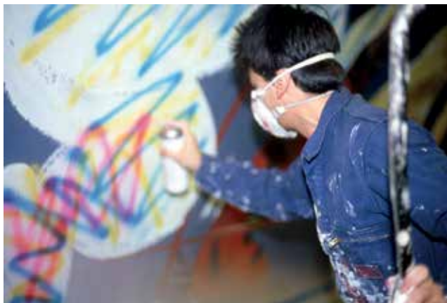
Mark, Dura lex est (av. 2019), collection Mucem, Marseille