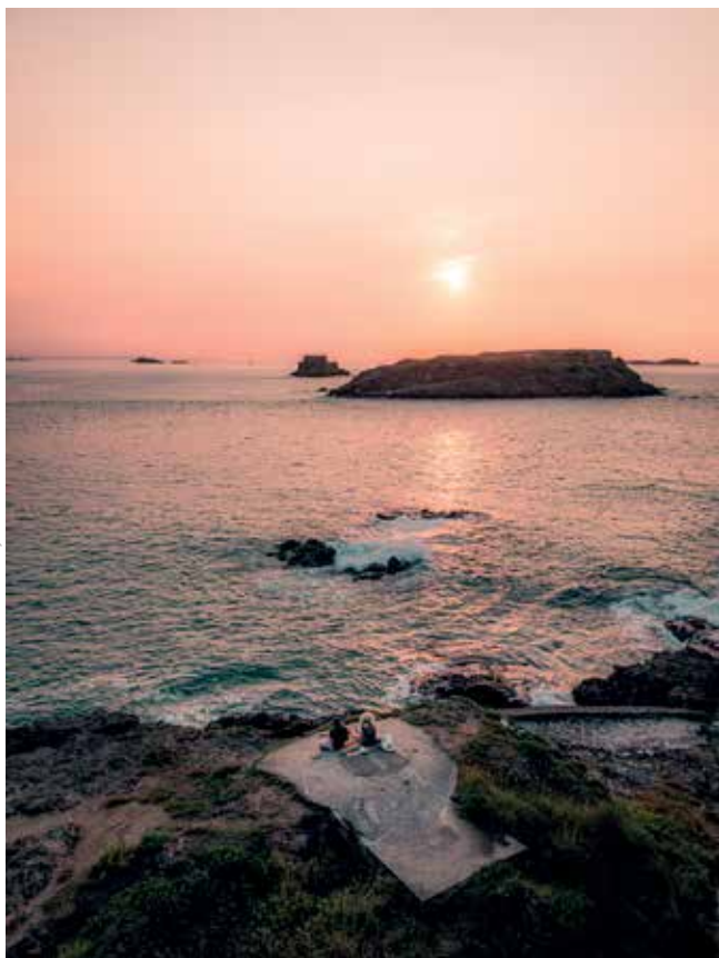
Coucher de soleil sur le Grand Bé à Saint-Malo