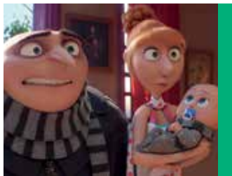
Moi, moche et méchant 4