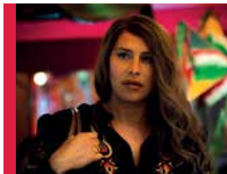
Emilia Pérez

Ça commence comme Old (2021), par une sortie en famille tout ce qu'il y a de plus rassurante. Ça vire vite au cauchemar avec, comme dans le film précité, une unité de lieu (la salle de concert remplaçant la plage maléfique) qui ne fait que renforcer l'angoisse chez le spectateur. Trap s'annonce comme du grand M. Night Shyamalan, mis en scène avec un perfectionnisme obsessionnel qui devrait ravir les fans d'Hitchcock.