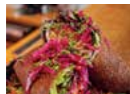
© Crêperie au Marché des Lices