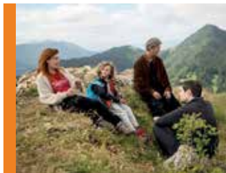
Le roman de Jim

On pensait bien la connaître, la petite Riley, à force de se balader dans son cerveau gouverné par Joie, Tristesse, Colère, Dégoût et Peur. Mais voilà, la jeune fille est désormais une adolescente et le quartier général sorti de l'imaginaire Pixar est mis sens dessus dessous quand débarque Anxiété. 9 ans après un premier coup de maître, Vice-versa est de retour. Toujours aussi inventif, ludique et sacrément intelligent !