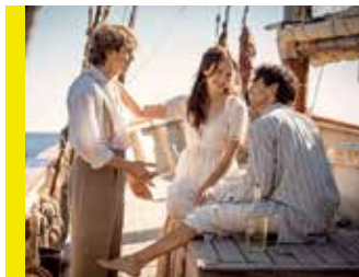
Le comte de Monte-Cristo © Patrice Jérôme Prabois