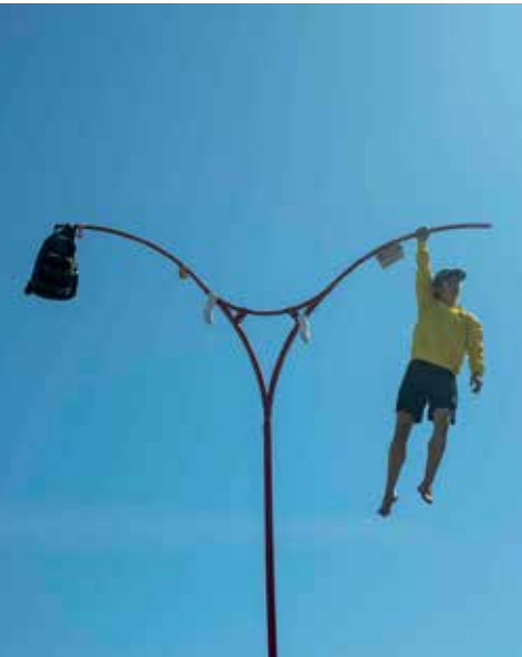
Rouge Merveille