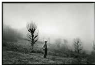
Le Villaret. Département de la Lozère, Languedoc Roussillon, 1993