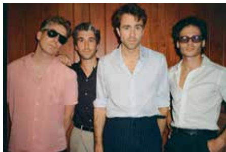
The Vaccines