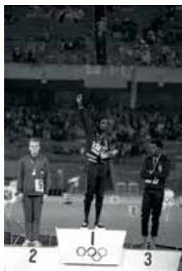
Mexico City, Mexique, 1968. Jeux Olympiques. Bob Beamon