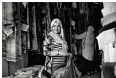
Alger, 2019