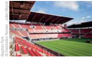
Roazhon Park

Le rouge et noir pour le stade rennais et l'antifascisme.