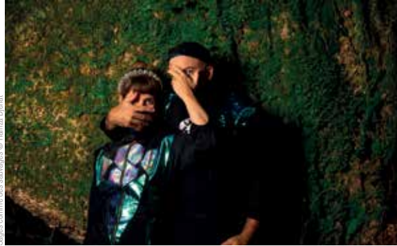
Sages comme des sauvages