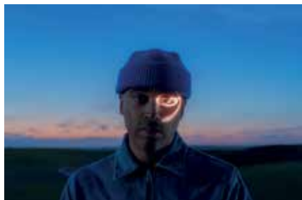
Patrice © DR