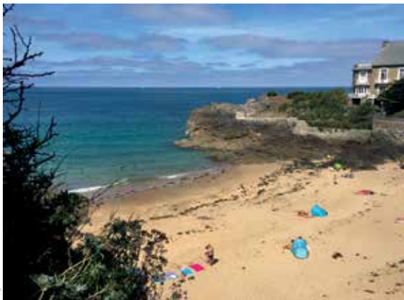
Plage du Nicet, Saint-Malo