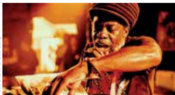
Abba Shanti

LES VIEILLES CHARRUES Du 11 au 14 juillet, Carhaix.