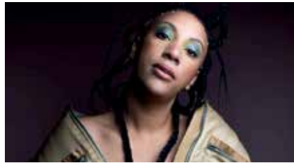
Emane © Claire Hubiau