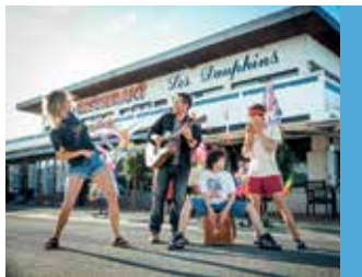
La Famille Hennedricks