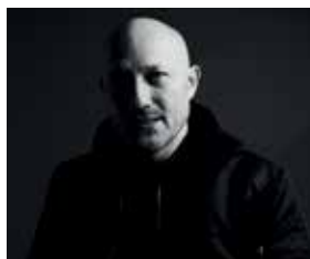
Paul Kalkbrenner