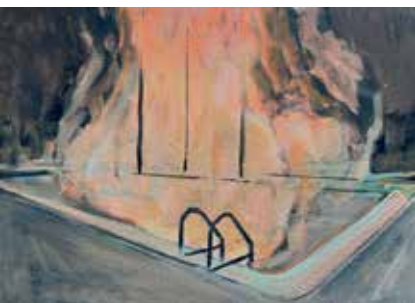
Série Entrassement, acryliques sur toile © Marie Vandooren