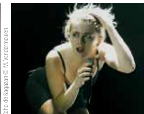
Zaho de Sagazan