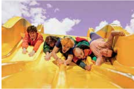
I'm from la nuit - Bou