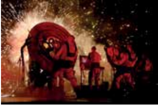
Au pré du son - Météoro Son Concert de feu