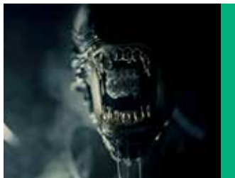
Alien: Romulus