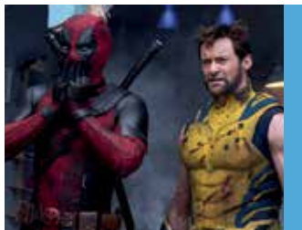
Deadpool & Wolverine