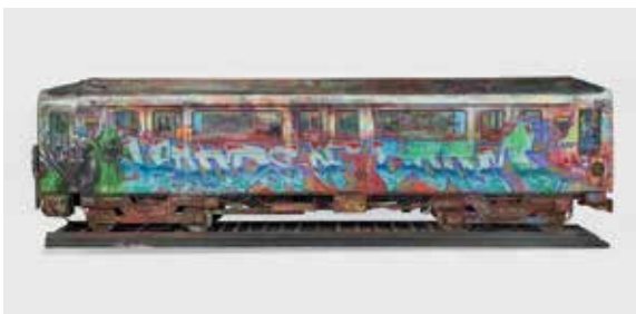
Sidney, Memento de wagon MF 77 lignes 13, 2013, collection Mucem, Marseille